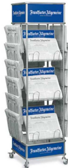
FAZ Verkaufsturm 55x180cm