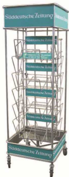
SZ Verkaufsturm ca. 60x180cm SZ Zeitungsleiter