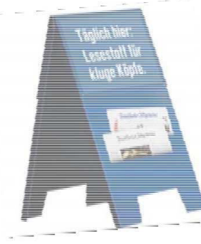
FAZ-Tafel Maße: 47x85cm